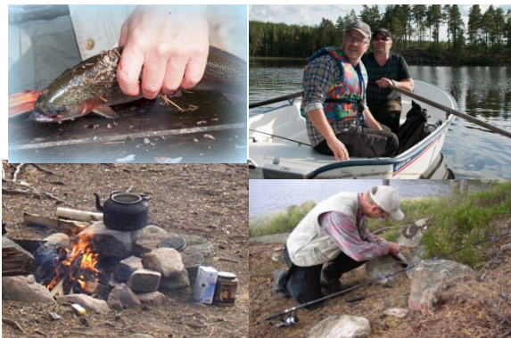
Fiske efter regnbåge och öring Avkoppling och samvaro