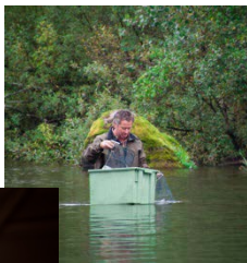
Kräfftiske i ett av södra Sveriges bästa kräfftiskevatten